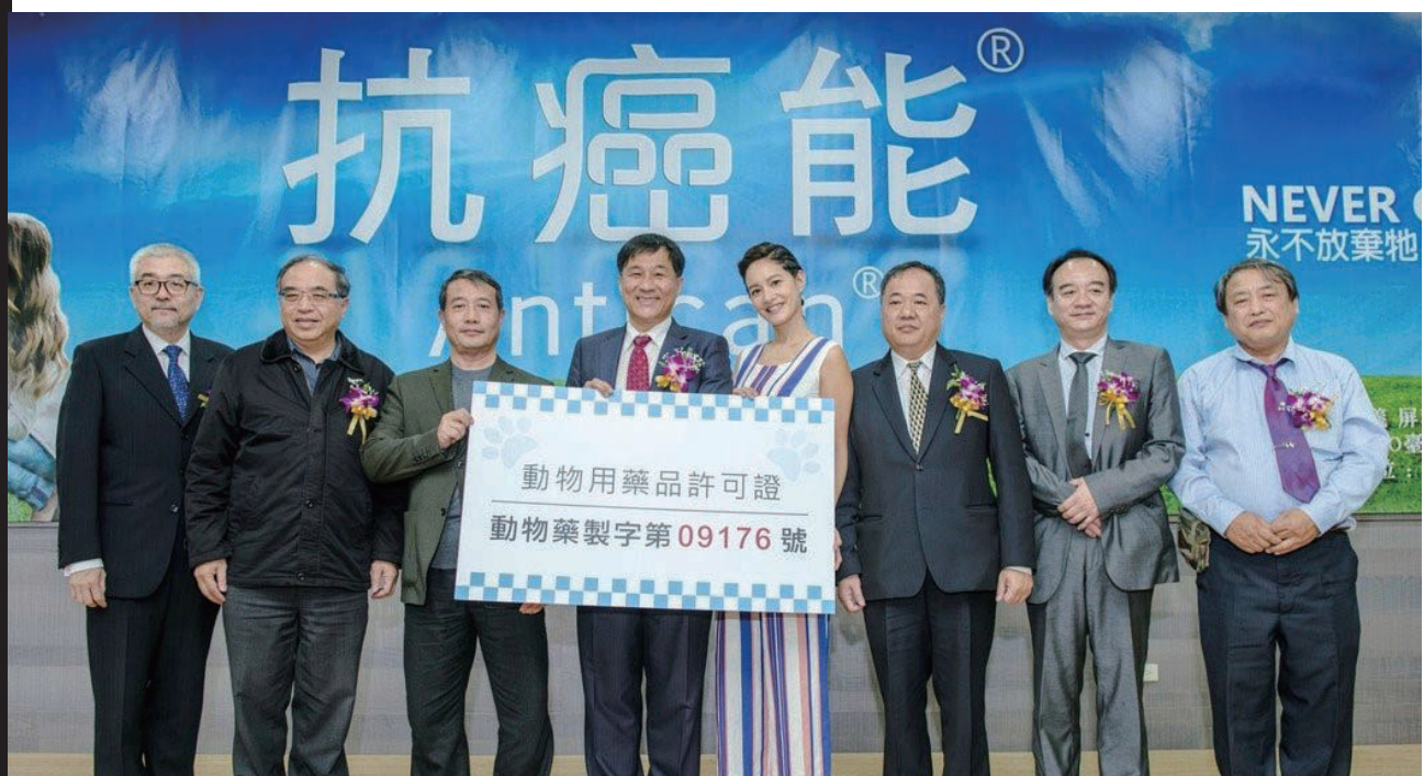
臺灣動藥「抗癌能®」上市說明會

2012年，是臺灣專業動物新藥研發公司，其所研發之寵物癌症治療新藥「抗癌能®」，經農委會發予首張寵物用藥藥證(動物藥製字第09176號)，為全球第三支、亞洲第一支寵物癌症用藥，在臺灣適應症為犬隻圍肛腺瘤，是腫瘤內注射之針劑型藥物。藥物注射後會直接作用於癌症細胞，使用時僅需對犬隻做簡單保定，不需麻醉，無傳統化療藥的副作用，提供飼主多一種治療選項。